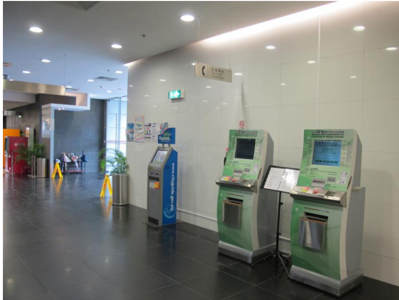
氹仔北安出入境事務廳大樓設有辦理《刑事紀錄證明書》自助服務機