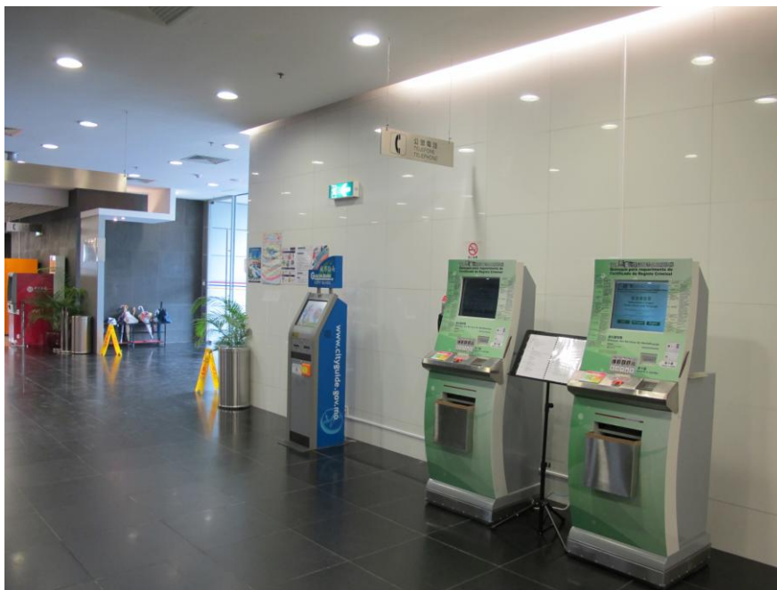
Quiosques para requerimento do Certificado de Registo Criminal, instalados no Edifício do Serviço de Migração, no Pac On Taipa