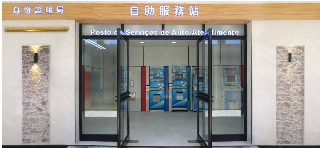
Posto de serviços de auto-atendimento da DSI, no Seac Pai Van, em Coloane