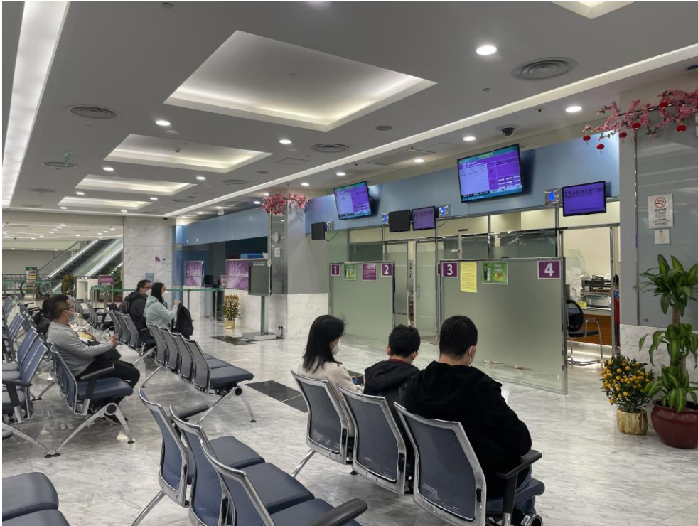
O Instituto para os Assuntos Municipais envia pessoal ao Centro de Serviços da RAEM na Areia Preta para prestar apoio ao tratamento de documentos no fim-de-semana