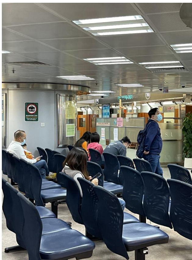
A Direcção dos Serviços de Identificação da Avenida da Praia Grande recebe os pedidos com marcação prévia no fim-de-semana, das 09H00 às 21H00