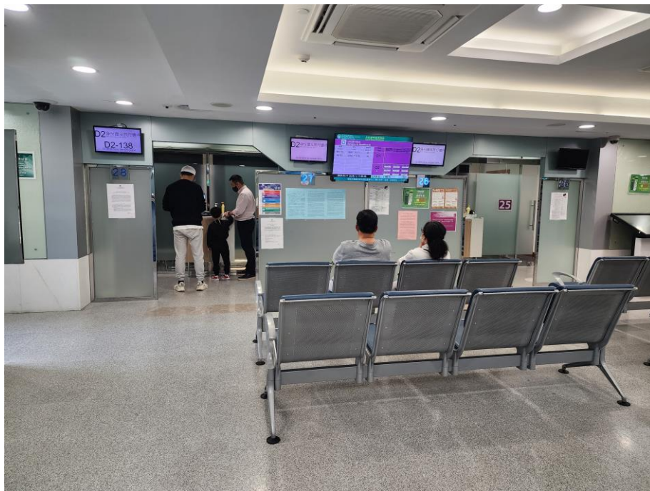
O Instituto para os Assuntos Municipais envia pessoal ao Centro de Serviços da RAEM das Ilhas para prestar apoio ao tratamento de documentos no fim-de-semana