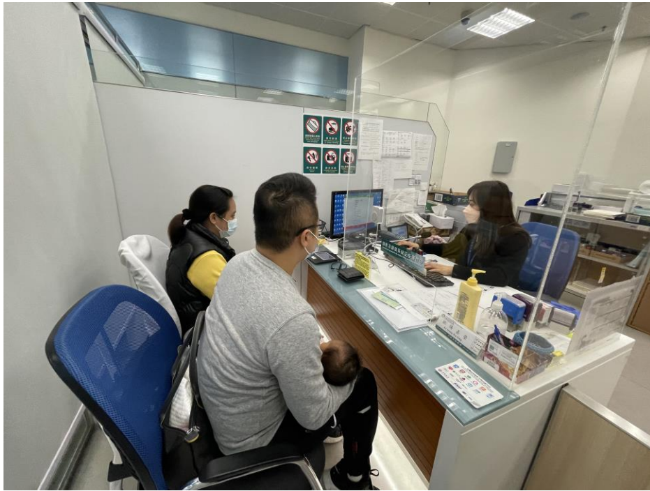
Os cidadãos pedem o tratamento dos documentos no fim-de-semana

A DSI apela novamente aos indivíduos que preenchem os requisitos para utilizarem, prioritariamente, a “Conta Única de Macau” ou os quiosques de auto-atendimento para tratar, por via electrónica, do requerimento de documentos. Para mais informações, queira ligar para a linha aberta da DSI (2837-0777 ou 2837-0888) ou enviar email para info@dsi.gov.mo .