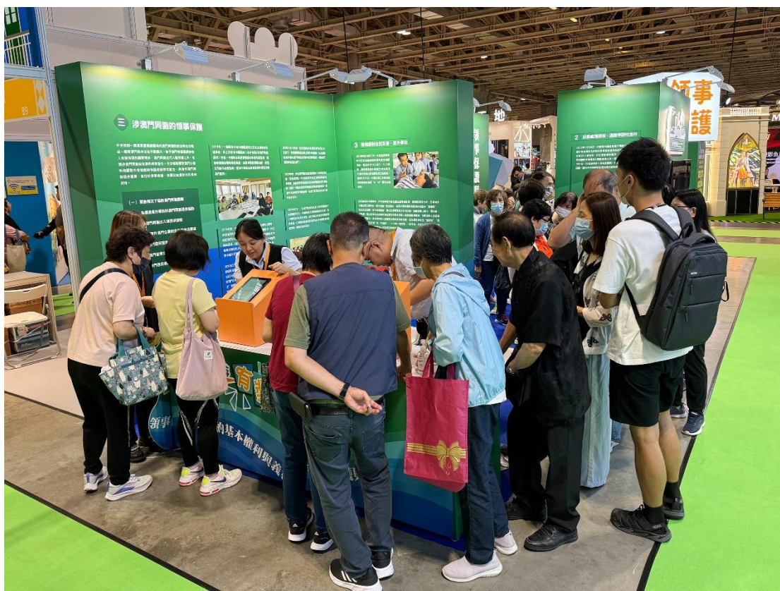
市民踴躍參與展位遊戲