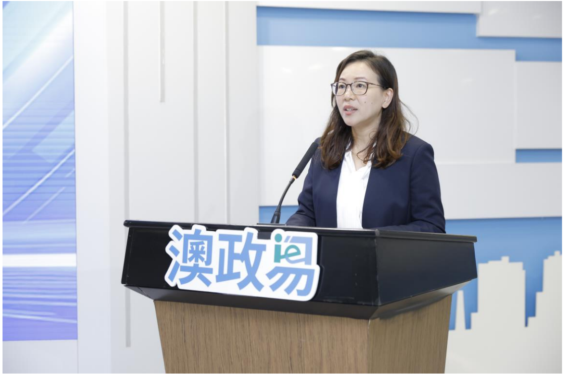
澳门特别行政区政府身份证明局代局长罗翹卿致辞